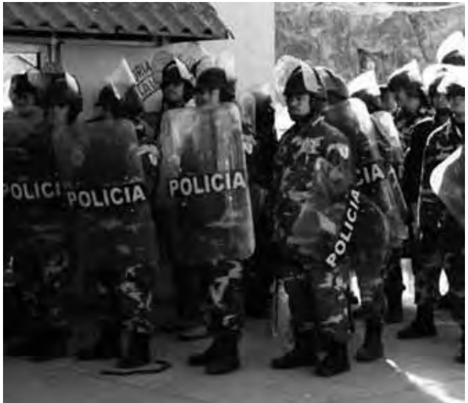
Em 11 de janeiro de 2008, 700 agentes armados da polícia estadual e federal expulsam 1.500 mineiros grevistas que estavam reivindicando melhoras nas condições de saúde e segurança em uma mina do Grupo México em Cananea, Sonora, México

Em abril de 2007, o Ministério do Trabalho mexicano conduziu uma inspeção de dois dias na mina de Cananea e identificou 72 medidas corretivas individuais, incluindo a instalação de precipitadores de pó, o conserto de freios avariados em guindastes, a eliminação de riscos elétricos e um esforço de limpeza geral